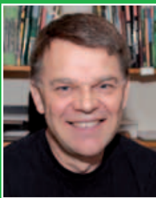
TEXT: THOMAS B ANDERSSON ILLUSTRATIONER: ROLF SVENSSON