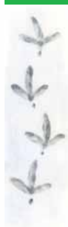
EN MÄSTARE PÅ ATT LURAS.

MASTIGA FÅGELSPÅR. Här har vår största, vilda hönsfågel traskat fram. Tjädertuppens fot är hela 10-11 cm lång och 8-9 cm bred. Hönsens är något mindre. Orrrens fotstämpel är betydligt mindre än tjäderns. Tårna på tjädern lämnar breda avtryck eftersom de är fjäderbeklädda. Hos fasanen är tårna nakna och spårstämpeln blir därför smalare och spensligare.